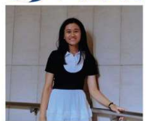
卒業生 イーイーボ